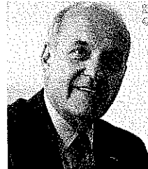
Götz W. Werner: „Werden Sie Menschenkenner!“