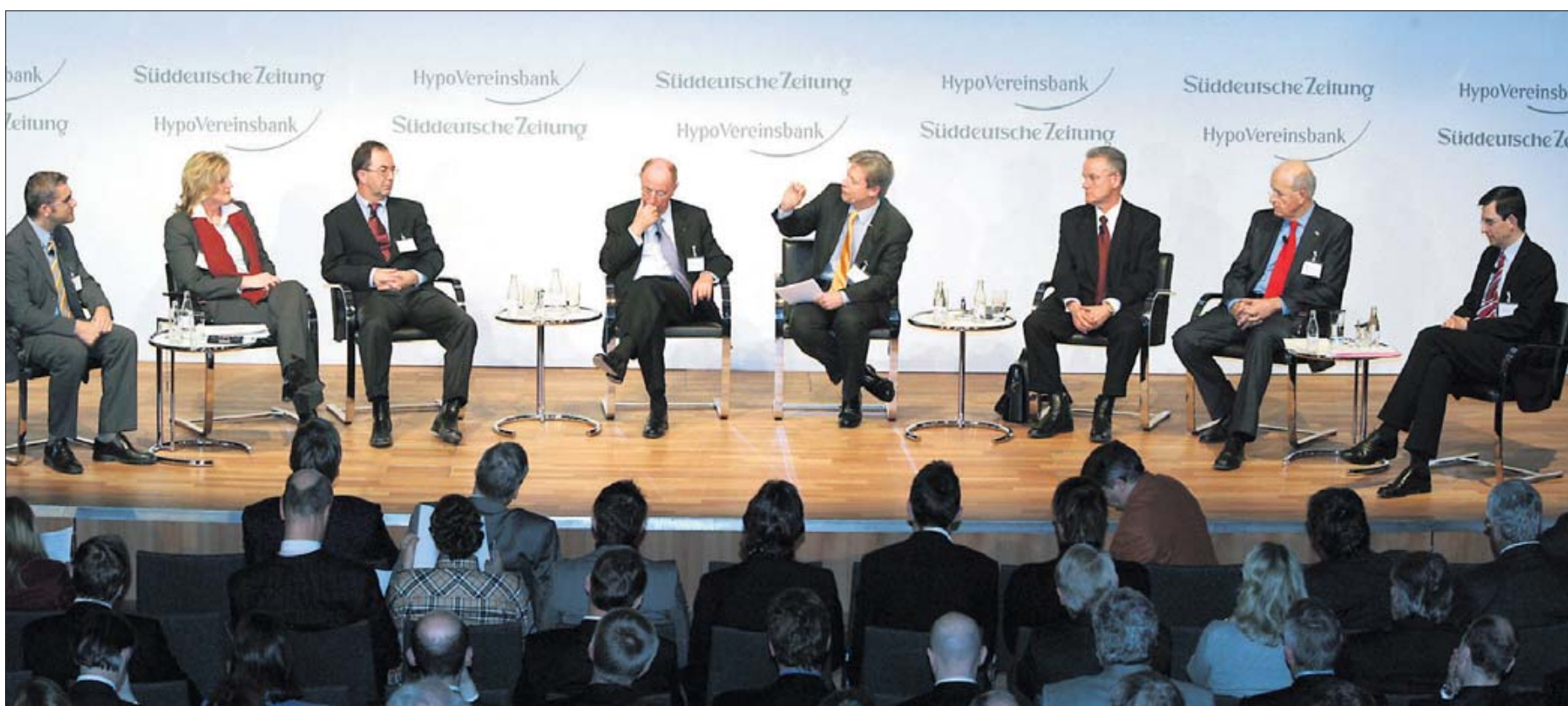
In Schule und Familie, darüber waren sich die Teilnehmer des Expertenforums einig, müssen Kreativität und Begeisterungsfähigkeit geweckt werden.